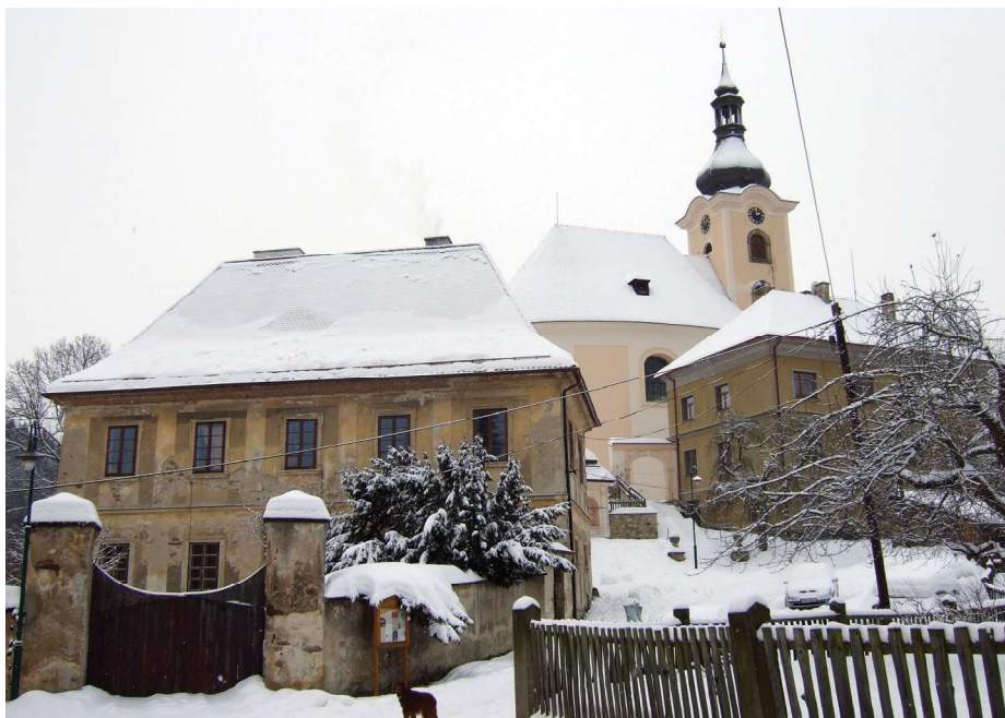
53 | Další z pohledů na sakrální okrsek, dokazující jeho strategickou polohu.

pokladnu byly poddanské dávky a platy spojené s tržní funkcí Úterý přínosem, takže jistě usiloval o obnovu a udržení normálního života v obci. Jak ostatně ukazuje i jeho péče o provoz bohoslužeb. Je pravděpodobné, že častěji než s Bohuslavem přišli Úterští do kontaktu s jeho synem Hynkem, který (soudě dle datací korespondence) sídlil na Krasíkově a Boru, 108 zatímco jeho mocný energický otec prodléval více na Krumlově, odkud řídil rožmberské dominium, jehož byl dočasným správcem. Bohuslava jeho válečná i politická jednání plně zaměstnávala a Úterý bylo jen jedním z nespočetných majetků, které se octly pod jeho vládou.