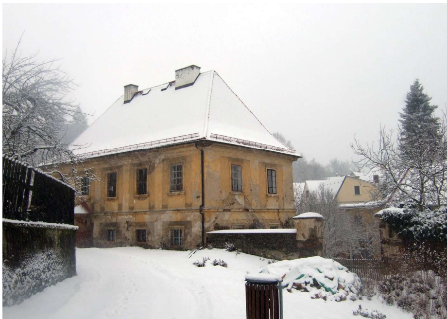
49 | Dnešní stezka pro pěší obcházející hřbitovní zeď od jihu směrem k faře č. p. 6 (na snímku) vede v linii původních příkopů, tvořících součást opevnění kostela.

munda skutečně exkomunikoval. V květnu adresovali opatu a celému konventu další důraznou výzvu k zřeknutí se kacířského krále členové Zelenohorské jednoty. Ke zdi tlačení opat poté zřejmě klášter opustil a uchýlil se do Chebu, města katolického, ale loajálního Poděbradovi. Krátce na to, 29. května 1467, dorazili šlechtici z papežského tábora včetně tepelských sousedů Bohuslava ze Švamberka, Buriana z Gutštejna, obou Jindřichů z Plavna a Viléma z Volfštejna ke klášternímu areálu opuštěnému královskými ozbrojenci a vymohli na zbývajících členech konventu přísahu věrnosti. Bez ohledu na jejich podrobení 30. května klášter bezohledně vyplenili.