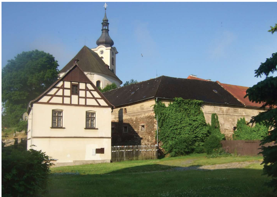
52 | Rozlehlý farní dvůr (zde neomítnuté nároží) zabírá nejspíš prostor původní johanitské komendy.

se i jiné dobyté statky vrací původním majitelům, že to nemá v úmyslu (s argumentem, že jeho zboží odňaté od manětínského panství také ještě stále drží žlutický pán Jan z Vřesovic). 99 Tepelští následovně požádali o intervenci krále, takže 5. června 1480 panovník osobně Švamberka napomínal, aby městečko konečně vydal. 100 Nejspíš marně.